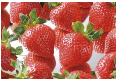
○福岡県産『あまおう』